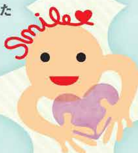
広島市PTA 協議会の マスコット キャラクター 「スマイル」

活動を通して、様々な考え方に触れ、助け合い・支え合いの中で、「相談できる人脈」が生まれるのもPTA活動の魅力のひとつです。